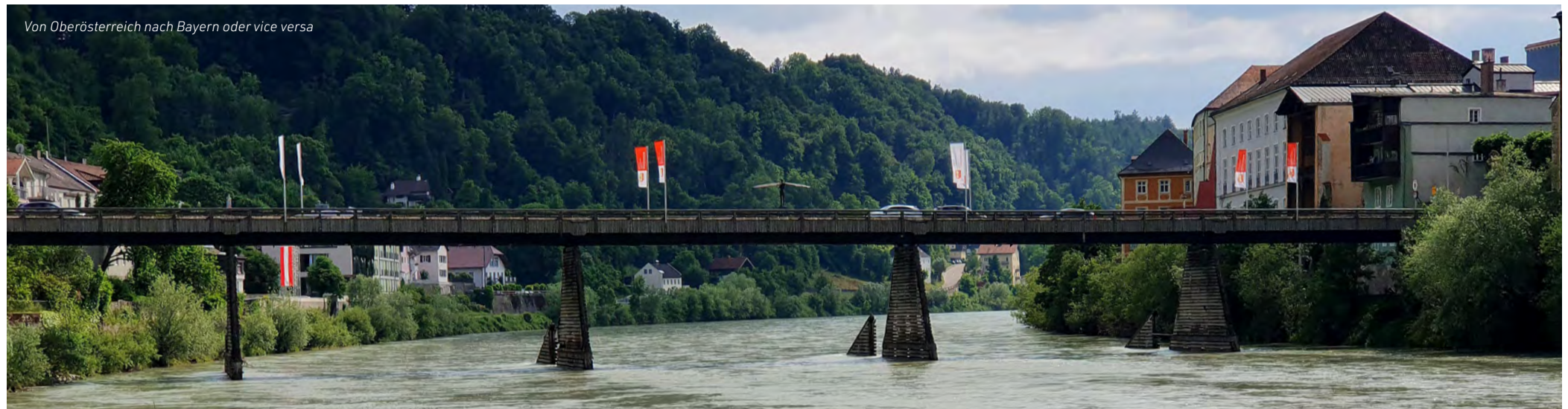
Von Oberösterreich nach Bayern oder vice versa

Bis zum Jahr 1841 gab es zwischen Tittmoning in Bayern und Ettenau (Ostermiething) in Oberösterreich nur eine Fährverbindung über die Salzach. 1842 wurde eine 255 m lange Holzbrücke gebaut, 1934 eine neue Betonbrücke eröffnet. 2020 einigten sich die beiden Nachbargemeinden darauf, die mittlerweile ausgediente Verbindung zu erneuern, um die Wirtschaftsräume besser zu vernetzen, wie es heißt.