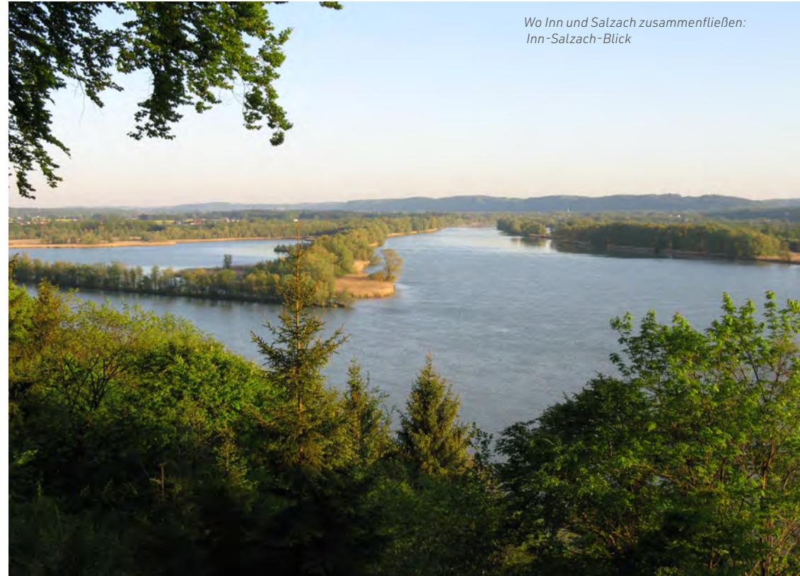
Wo Inn und Salzach zusammenfließen: Inn-Salzach-Blick

192 Stufen und oben die Belohnung: Vom Turm der Braunauer Stadtpfarrkirche St. Stephan, mitten in der Altstadt, haben Schwindelfreie auf der Ebene der Aussichtsplattform auf 38 m Höhe einen großartigen Blick über Grenzen hinweg: über den Stadtplatz, über die Dächer, in die Region des Bezirks, Richtung Simbach in Bayern und auf den Inn und das Europareservat Unterer Inn. Zum Bau der Kirche wurde im Übrigen Tuffstein verwendet, der heute noch entlang der Salzach zu finden und mittlerweile geschützt ist.