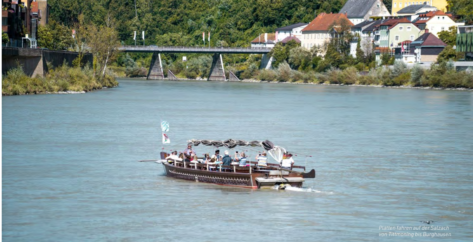
Plätten fahren auf der Salzach von Tittmoning bis Burghausen