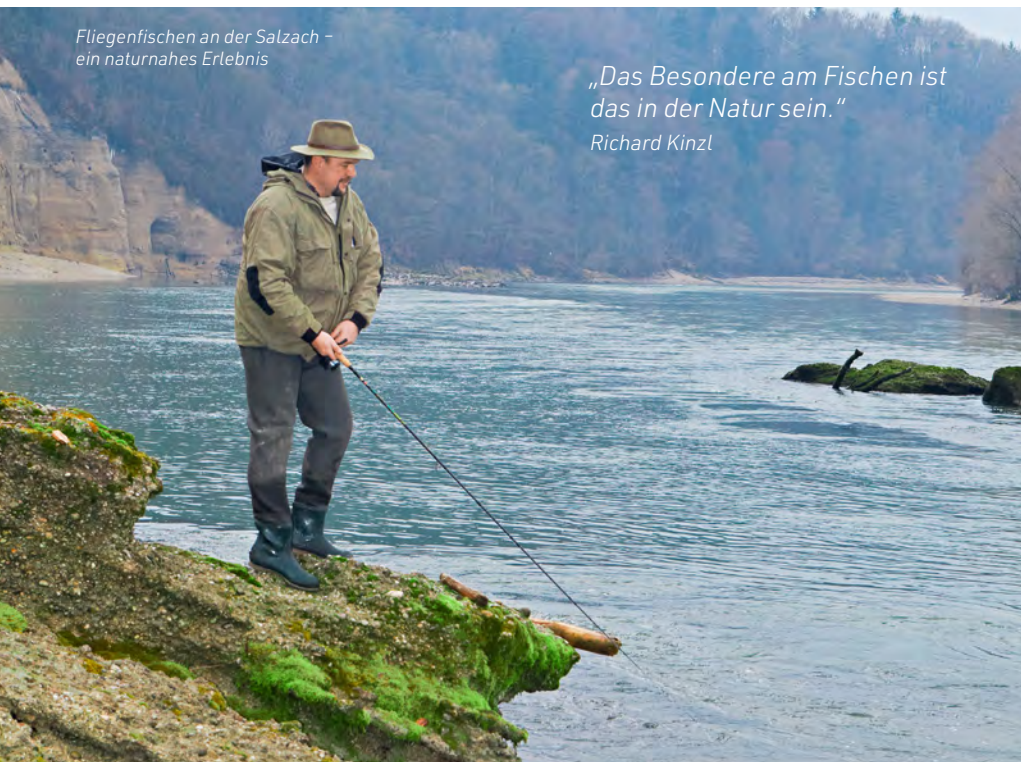
Fliegenfischen an der Salzach – ein naturnahes Erlebnis

Wenn man Forellen fischt, dann ist laut Kinzl das Gebiet Burghausen/Hochburg-Ach sehr gut. „Die Salzach ist schnellfließend. Weiter unten Richtung Inn beginnt der Rückstaubereich vom Kraftwerk in Ranshofen, die Fließgeschwindigkeit verlangsamt sich, die Region wird anders: Hier kann man Hechte und Waller fangen.“