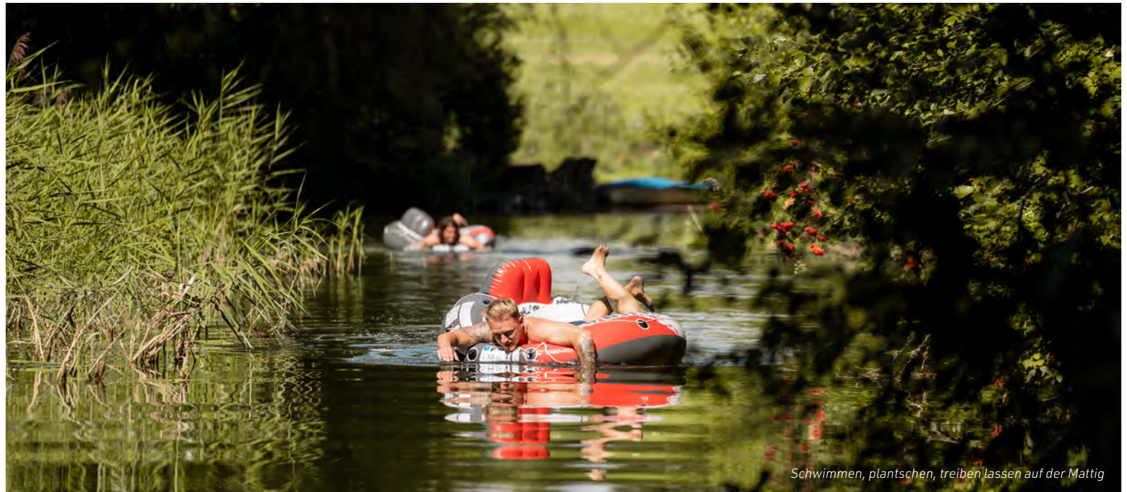
Schwimmen, plantschen, treiben lassen auf der Mattig

Mit kleinen Booten und Schläuchen lässt sich die Mattig stückweise leicht und gemütlich befahren. Längere Touren können Geübte auf der Salzach mit dem Kanu oder Kajak machen. Ab Tittmoning bis zum Inn geht es ebenso idyllisch – und vielleicht etwas spektakulärer – vorbei an den bewaldeten Steilufern, am Kloster Raitenhaslach, an Bughausen, am Kreuzfelsen und am Salzachdurchbruch. Die Strömung nimmt bis zur Mündung der Salzach in den Inn ab. Verschiedene Rampen helfen am Weg beim Ein- und Aussteigen. Das Naturschutzgebiet darf nicht befahren werden, das gilt auch für den Unteren Inn (zumindest auf bayerischer Seite).