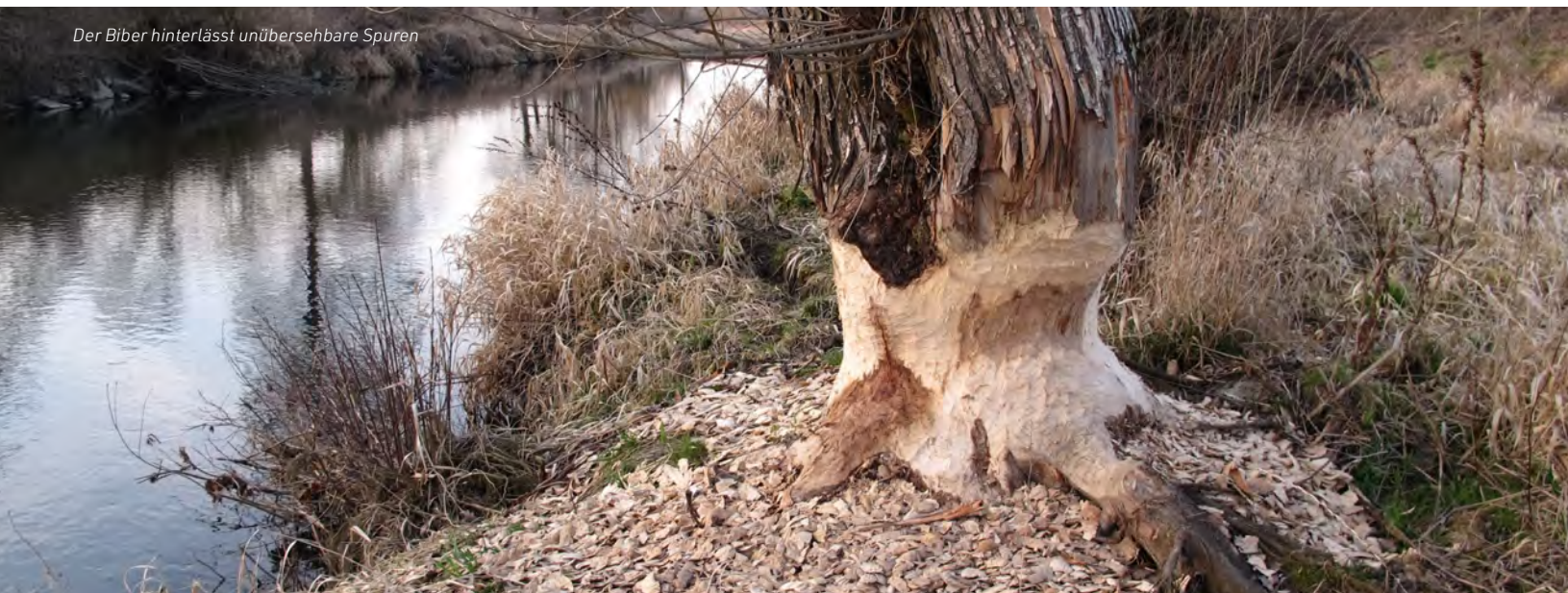
Der Biber hinterlässt unübersehbare Spuren

Projekt „Regionales Bibermanagement“ und Handbuch „Mit dem Biber leben!“ von Gerald Hölzler, Gundi Habenicht und Hans-Jürgen Baschinger: www.oeu-umweltanwaltschaft.at