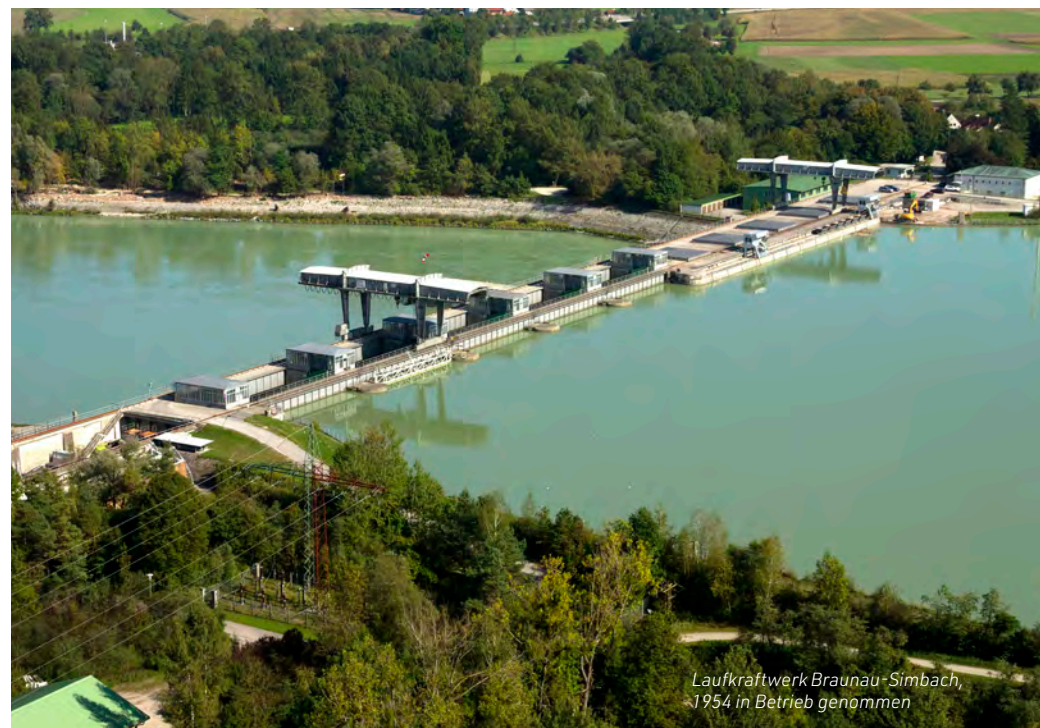
Laufkraftwerk Braunau-Simbach, 1954 in Betrieb genommen

Ein mächtiger Stromproduzent ist der Inn. Der Verbund, größtes Energieunternehmen in Österreich und Wasserkraftwerksbetreiber in Bayern, hat allein am Inn 21 große Kraftwerke in Betrieb, vier davon im Grenzgebiet Innviertel und Bayern. Das Laufkraftwerk Braunau-Simbach liegt in Ranshofen (Gemeindegebiet Braunau, OÖ) und Kirchdorf am Inn (Bayern), wurde 1954 in Betrieb genommen und erzeugt im Jahr 550.000 MWh. Das Laufkraftwerk Ering-Frauenstein ist seit 1943 in Betrieb. Der Verbund versteht die Kraftwerke als „Mehrzweckanlagen“, welche eine nachhaltige Stromerzeugung mit Hochwasserschutz und