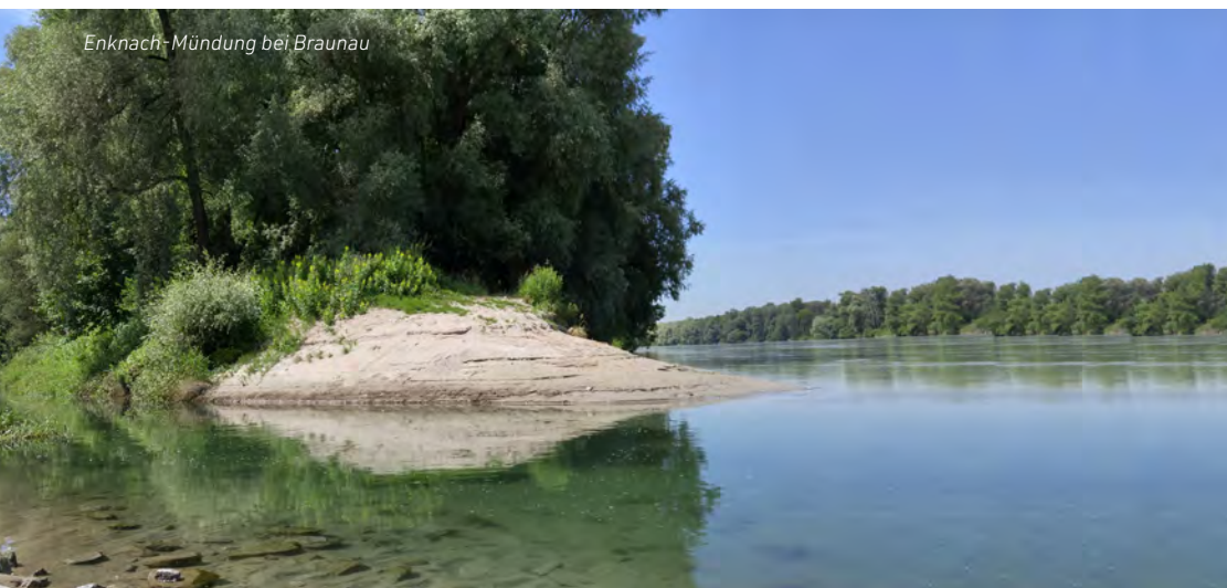
Enknach-Mündung bei Braunau

Auf Grund ihres natürlichen Charakters und der Moore und Feuchtwiesen ist die Enknach auf 4 km als Naturschutzgebiet ausgewiesen. Bei Ranshofen (Gemeinde Braunau) durchfließt die Enknach zudem das Naturschutzgebiet Buchenwald.