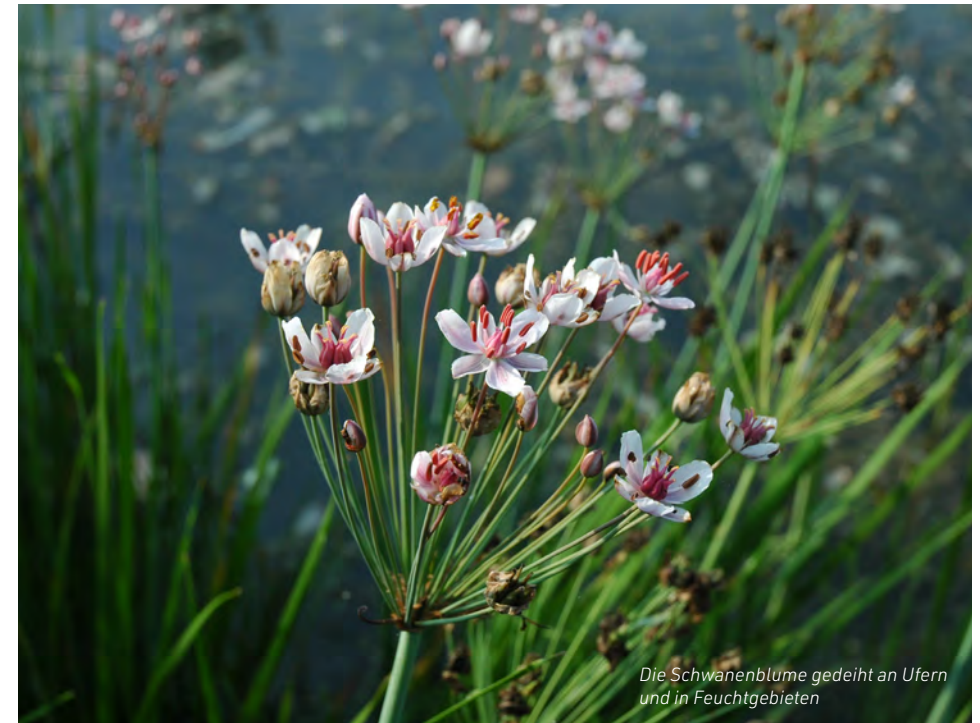
Die Schwanenblume gedeiht an Ufern und in Feuchtgebieten

Michael Hohla: „Das Innviertel. Landschaft & Pflanzen“, erhältlich in kleinen Buchhandlungen des Innviertels; www.michaelhohla.wordpress.com