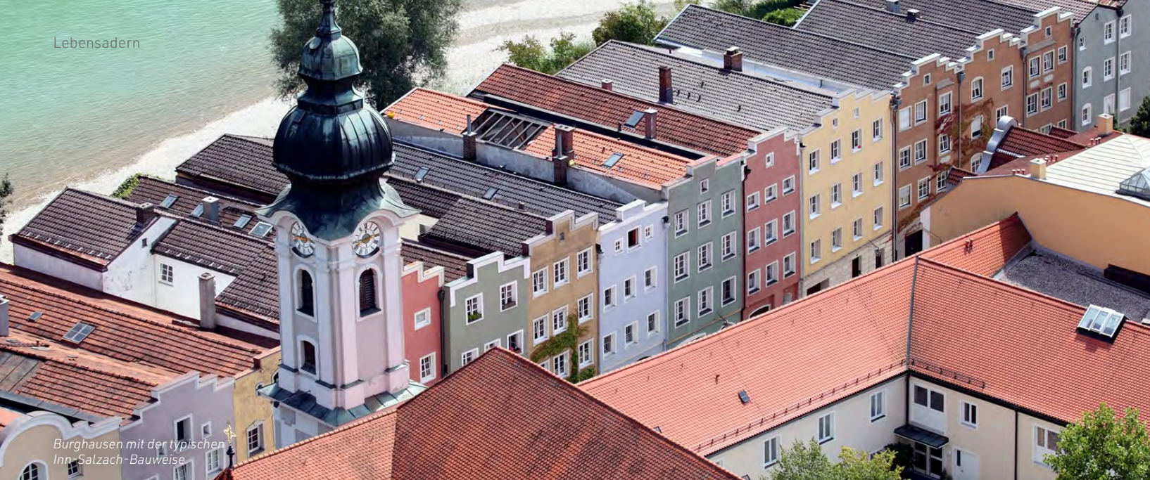
Burghausen mit der typischen Inn-Salzach-Bauweise