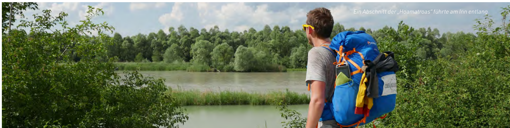
Ein Abschnitt der „Hoamatroas“ führte am Inn entlang