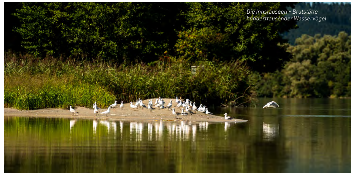
Die Innstauseen - Brutstätte hunderttausender Wasservögel

Das Europaschutzgebiet Ettenau (seit 2011) schließt an die „Salzachauen“ an und umfasst auch die wenig genutzten Buchenwälder an den steilen Hängen.