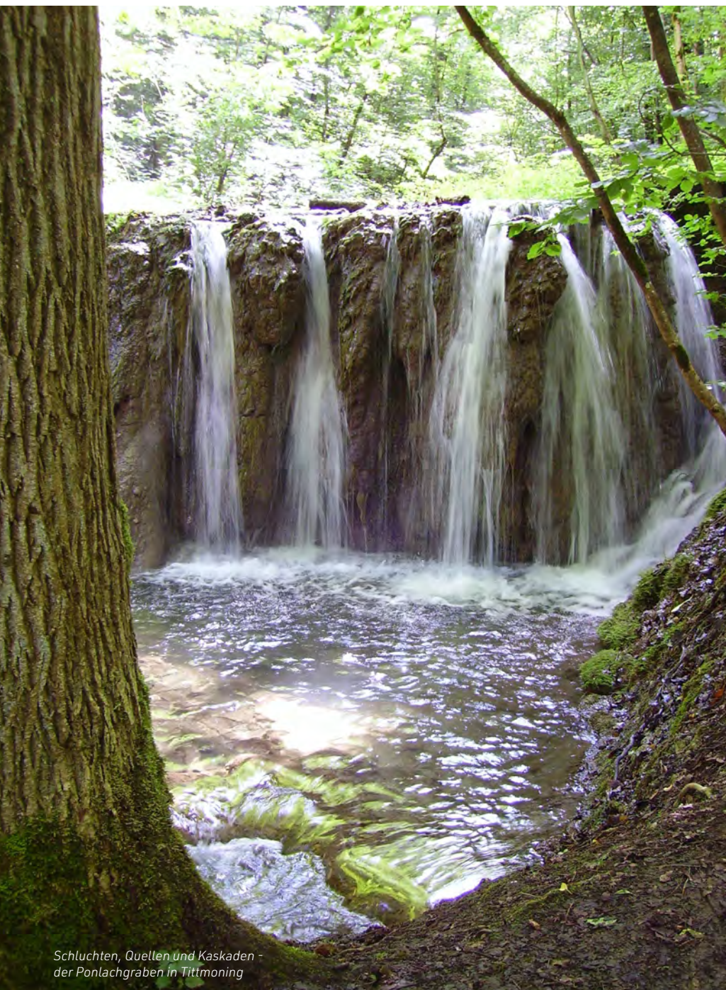
Schluchten, Quellen und Kaskaden - der Pontlachgraben in Tittmoning