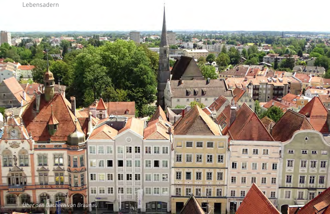
Über den Dächern von Braunau

Im Bezirk Braunau ist auch die Stadt Mattighofen von dem Architekturstil geprägt: Schöne Bürgerhäuser mit Blendfassaden in verschiedenen Farben gibt es auch hier auf beiden Seiten des 300 m langen Stadtplatzes. Auch das bayerische Tittmoning, an der Salzach gelegen und mit einer Brücke mit der Gemeinde Ostermiething in Oberösterreich verbunden, zeigt sich prächtig und harmonisch in der Bauart, die sich nach einem verheerenden Feuer im Jahr 1571 manifestierte. Der 300 m lange Stadtplatz ist von zwei Toren begrenzt und wird in der Mitte vom Stadtbach zweigeteilt. Einzigartig ist dabei der trapezförmige Grundriss. So ist der Platz im Norden 60,3 m breit, im Süden nur 26,4 m. Noch erhalten ist auch die Stadtmauer aus dem 14./15. Jahrhundert. Auf einer Anhöhe über der Stadt thront die mittelalterliche Burg, bei Weitem nicht so groß wie die von Burg- hausen, aber nicht minder sehenswert.