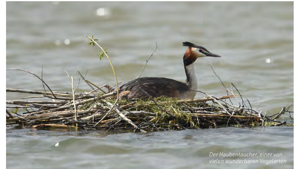
Der Haubentaucher, einer von vielen wunderbaren Vogelarten

Die Innstauseen entwickelten sich so zu einem der bedeutendsten Brut-, Rast- und Überwinterungsgebiete für Hunderttausende Wasservögel in Österreich und Süddeutschland. Die großen Verlandungszonen sind ideal für die Brut und die Nahrungssuche von zahlreichen Vogelarten. In den Flachwasserzonen schöpfen bis zu 20 verschiedene Watvögel aus dem Vollen. Zudem werden verschiedene Reiherarten (Silberreiher, Seidenreiher, Nachtreiher) gezählt, Seeadler sind zu sehen, genauso der Eisvogel, der Pirol und der Schwarzspecht. Seltene Fischarten in den strömungsreicheren Abschnitten des Inns sind Schied und Steingressling.