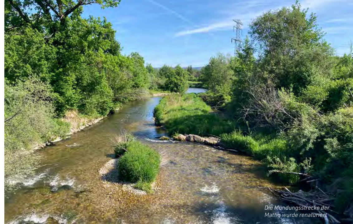
Die Mündungsstrecke der Mattig wurde renaturiert

Auch im Raum Mattighofen entstanden neue Naturflächen. Ab 2000 wurden entlang der Mattig mehrere Hektar Uferlandstreifen angekauft, Tümpel angelegt und bepflanzt. Eine artenreiche Flora und Fauna konnte sich hier entwickeln. Und auch die Mündungsstrecke der Mattig wurde renaturiert. Das Betonkorsett wurde entfernt. Flache Ufer, kleine Buchten, Strukturen aus Totholz und Steinen machen den Uferbereich bis zum Inn weit natürlicher mit vielfältigen Gewässerstrukturen. Wasservögel finden eine neue Lebenswelt vor wie auch die aus dem Inn aufsteigenden Fischarten der Nasen und Huchen ein Laichgebiet. Bei Hochwasser des Inns ist der Bereich Ausweich- und Rückzugsmöglichkeit für Wasserlebewesen. Und die Menschen haben einen beliebten Platz zur Entspannung in der Natur gewonnen.