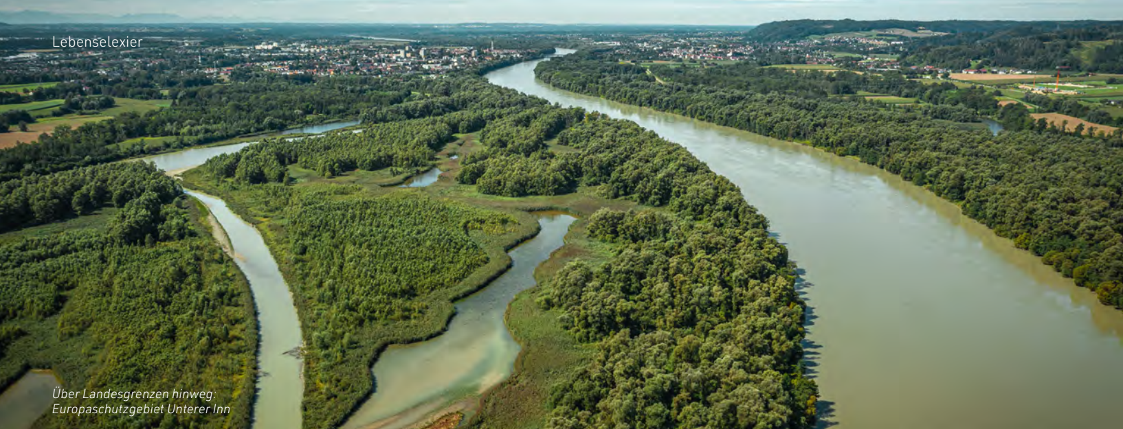
Über Landesgrenzen hinweg: Europaschutzgebiet Unterer Inn

In den alten Wäldern sind z. B. der Scharlachrote Plattkäfer und im Schilf die Bauchige Windelschnecke ansässig. An den Hochwasser- und Stauhaltungs-dämmen sind Rückzugsgebiete für viele seltene oder gefährdete Tier- und Pflanzenarten, etwa Orchideen wie das Helm-Knabenkraut, aber auch Wildbienen und Schmetterlinge, diverse andere Insekten, Reptilien und Kleinsäuger zu finden.