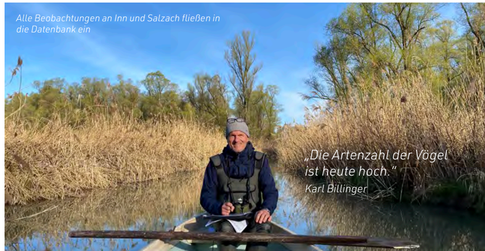
Alle Beobachtungen an Inn und Salzach fließen in die Datenbank ein

Etwa 300 verschiedene Vogelarten leben in dem außergewöhnlichen Reservat. Besonders im Frühling und Herbst tummeln sich hunderttausende Zugvögel in dem europäischen „Drehkreuz“. Etwa 130 Arten sind Brutvögel in dem Gebiet.