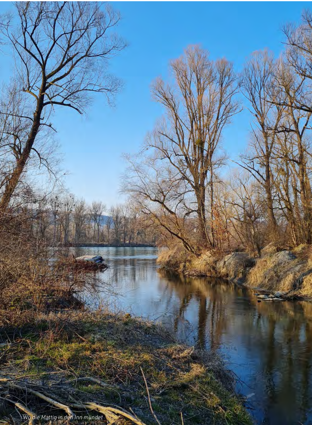
Wo die Mattig in den Inn mündet