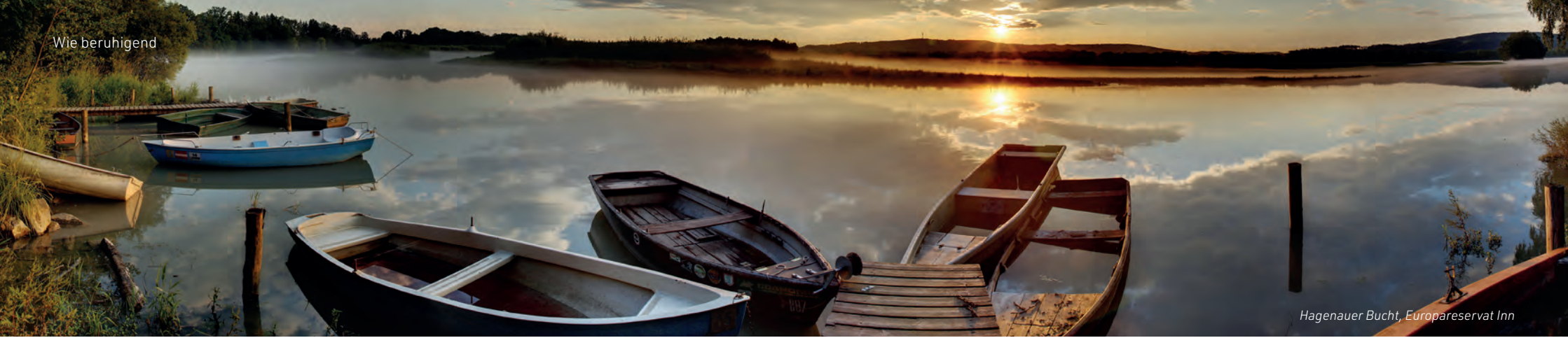
Hagenauer Bucht, Europareservat Inn