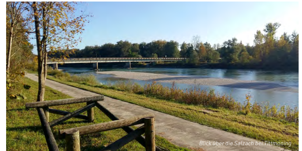
Blick über die Salzach bei Tittmoning