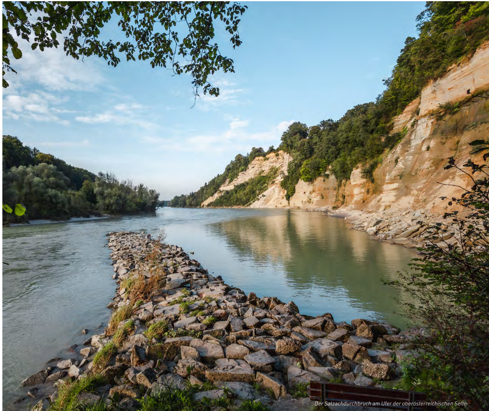
Der Salzachdurchbruch am Ufer der oberösterreichischen Seite