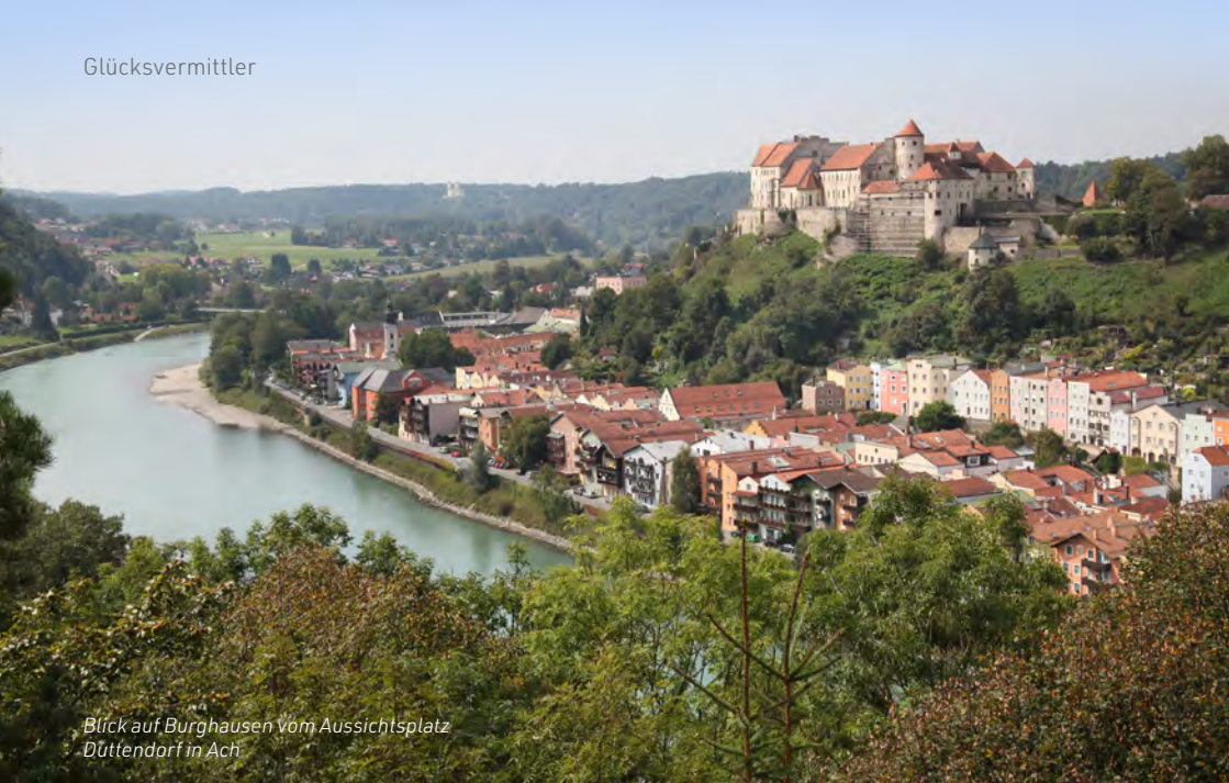
Blick auf Burghausen vom Aussichtsplatz Düttendorf in Ach