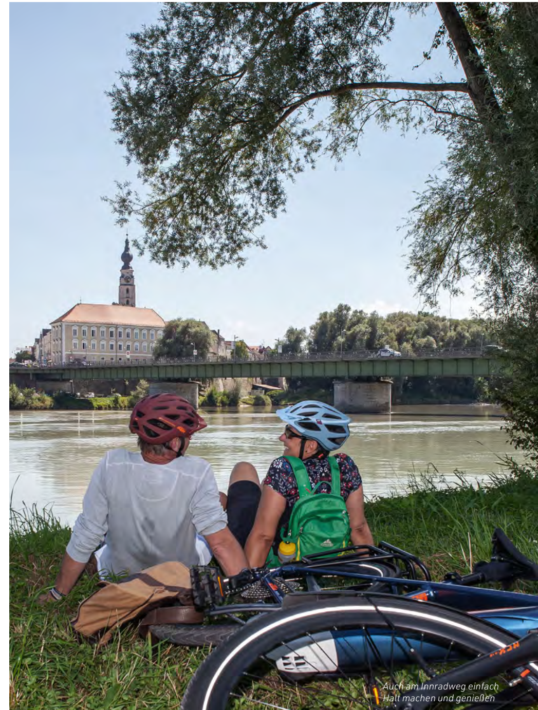
Auch am Innradweg einfach Halt machen und genießen